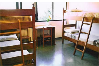
sopra l'Ostello del Chianti a Tavarnelle Val di Pesa.

Sotto il Centre Intégré de la Jeunesse et de l'Enfance di Douz (Tunisia) si occupa di offrire sostegno a bambini e giovani che vivono situazioni familiari problematiche.